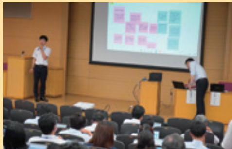
フレッシュ研修会