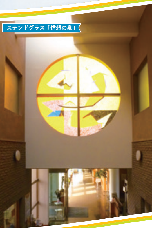
ステンドグラス「信頼の泉」