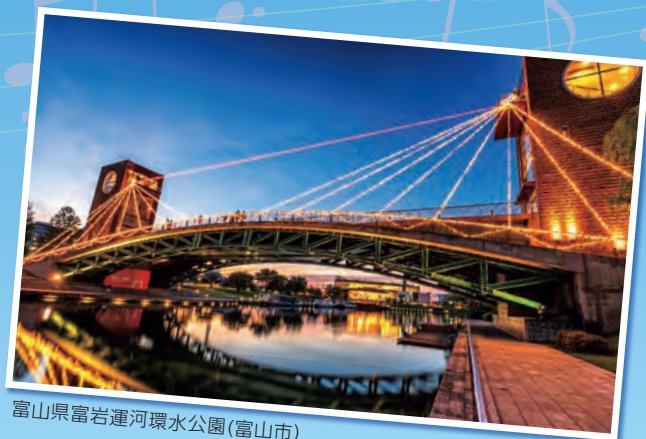
富山県富岩運河環水公園(富山市)