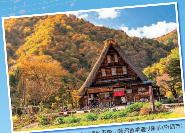
世界遺産五箇山菅沼合掌造り集落(南砺市)